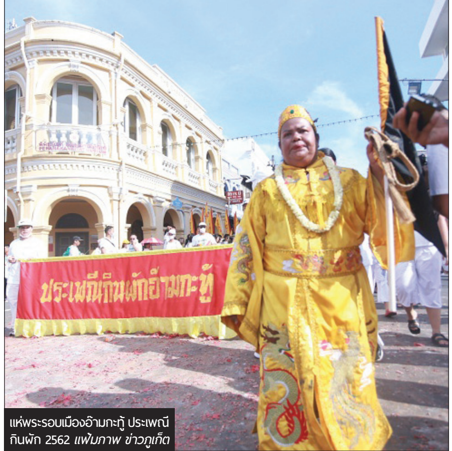
แห่ประรอบเมืองอำเภอกะทู้ ประเพณีกินผัก 2562 แพนภาพ ข่าวภูเก็ต

สมกับสถานการณ์ ทั้งด้านรูปแบบและจำนวนผู้เข้าร่วมพิธี รวมถึงอาจมีการกำหนดพื้นที่ในการประกอบพิธีกรรม ตามข้อกำหนดข้างต้น นอกจากนี้ทางคณะกรรมการศาลเจ้าได้มีมติให้งดการแสดงมหรสพ แต่อาจมีกิจกรรมสันทนาการในวัน