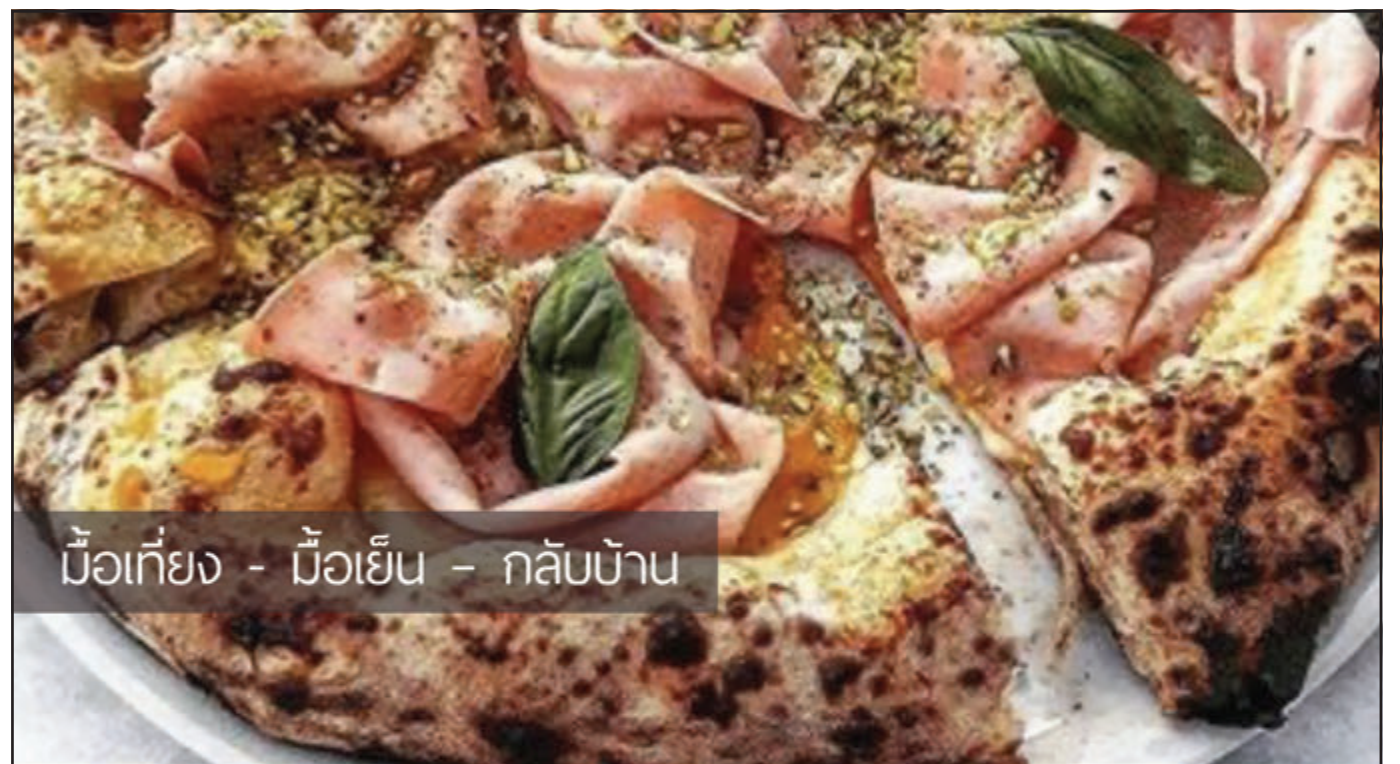
มือเก๋ียง - มือเย็น - กลับบ้าน

ชัย 1,000 ท่านแรก จะได้รับเหรียญรางวัล