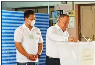
นายณรงค์ วุ่นซิ้ว ผู้ว่าราชการจังหวัดภูเก็ต เดินทางมาใช้สิทธิเลือกตั้งเป็นคนแรก ณ หน่วยเลือกตั้งที่ 22 เขตเลือกตั้งที่ 1

“หากประชาชนที่ไม่ได้ออกไปใช้สิทธิเลือกตั้ง และไม่ได้แจ้งเหตุของการไม่ไปเลือกตั้ง ตามระยะเวลาที่กำหนด อาจทำให้เสียสิทธิทางการเมืองบางประการได้ จึงอยากให้ประชาชนดำเนินการตามขั้นตอนอย่างถูกต้องครบถ้วน เพื่อเป็นสิทธิประโยชน์ของตนเอง” น.ส.อรพิน กล่าว