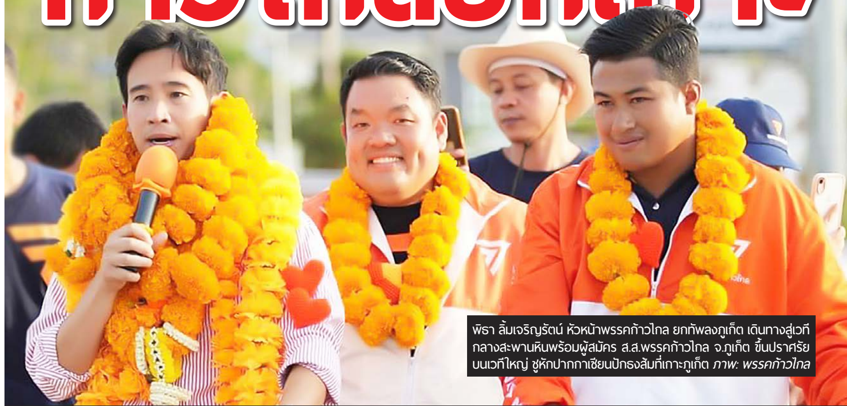
พิธี ล้มเจริณรัตน์ หัวหน้าพรรคก้าวไกล ยกทัพลงภูเก็ต เดินทางสู่เวทีกลางสะพานหินพร้อมผู้สมัคร ส.ส.พรรคก้าวไกล จ.ภูเก็ต ขึ้นปราศรัยบนเวทีใหญ่ ชูหลักปากกาเขียนปกรณณ์ที่เกาะภูเก็ต ภาพ: พรรคก้าวไกล