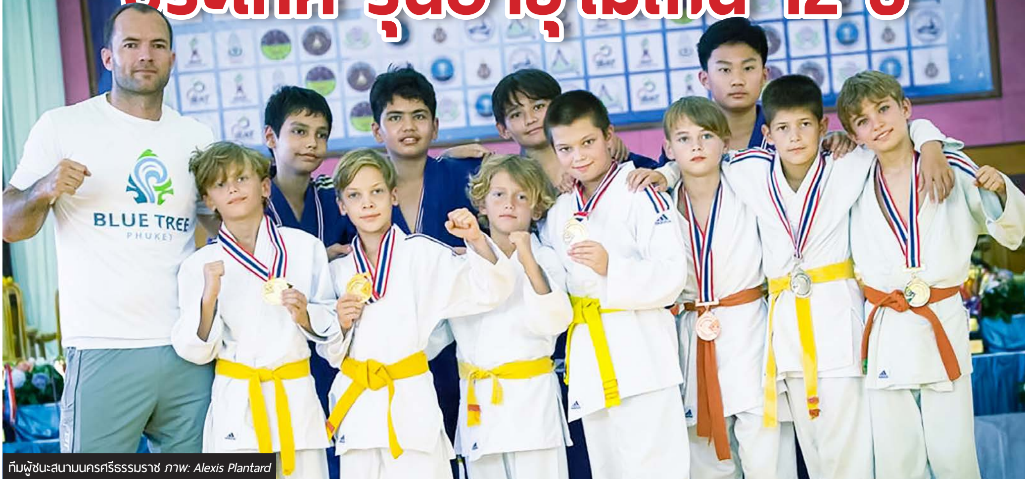
ทีมผู้ชนะเลิศสนามนครศรีธรรมราช