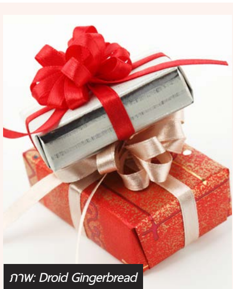
ภาพ: Droid Gingerbread