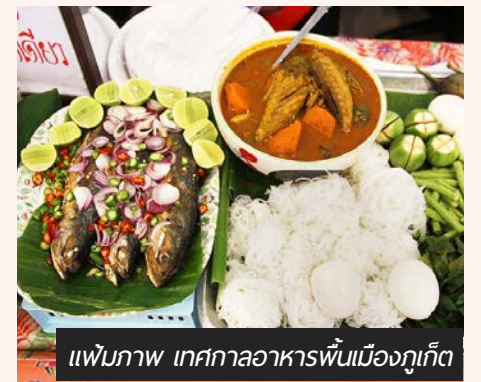
แฟ้มภาพ เทศกาลอาหารพื้นเมืองภูเก็ต

เป็นอีกหนึ่งเที่ยวบินที่ได้มีการเปิดเส้นทางมายังจังหวัดภูเก็ต ทำให้เห็นได้ว่าประเทศไทยยังคงเป็นจุดหมายปลายทางยอดนิยมในใจของนักท่องเที่ยวชาวต่างชาติ