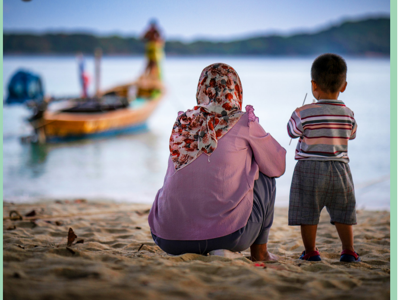
ยามเย็นราไวย์

หากท่านมีภาพทิวทัศน์แสนสวยสะดุดตาสะกดใจหรือภาพแปลกของภูเก็ต (ความละเอียดภาพสูง) ส่งอีเมลมาได้ที่: thai@classactmedia.co.th