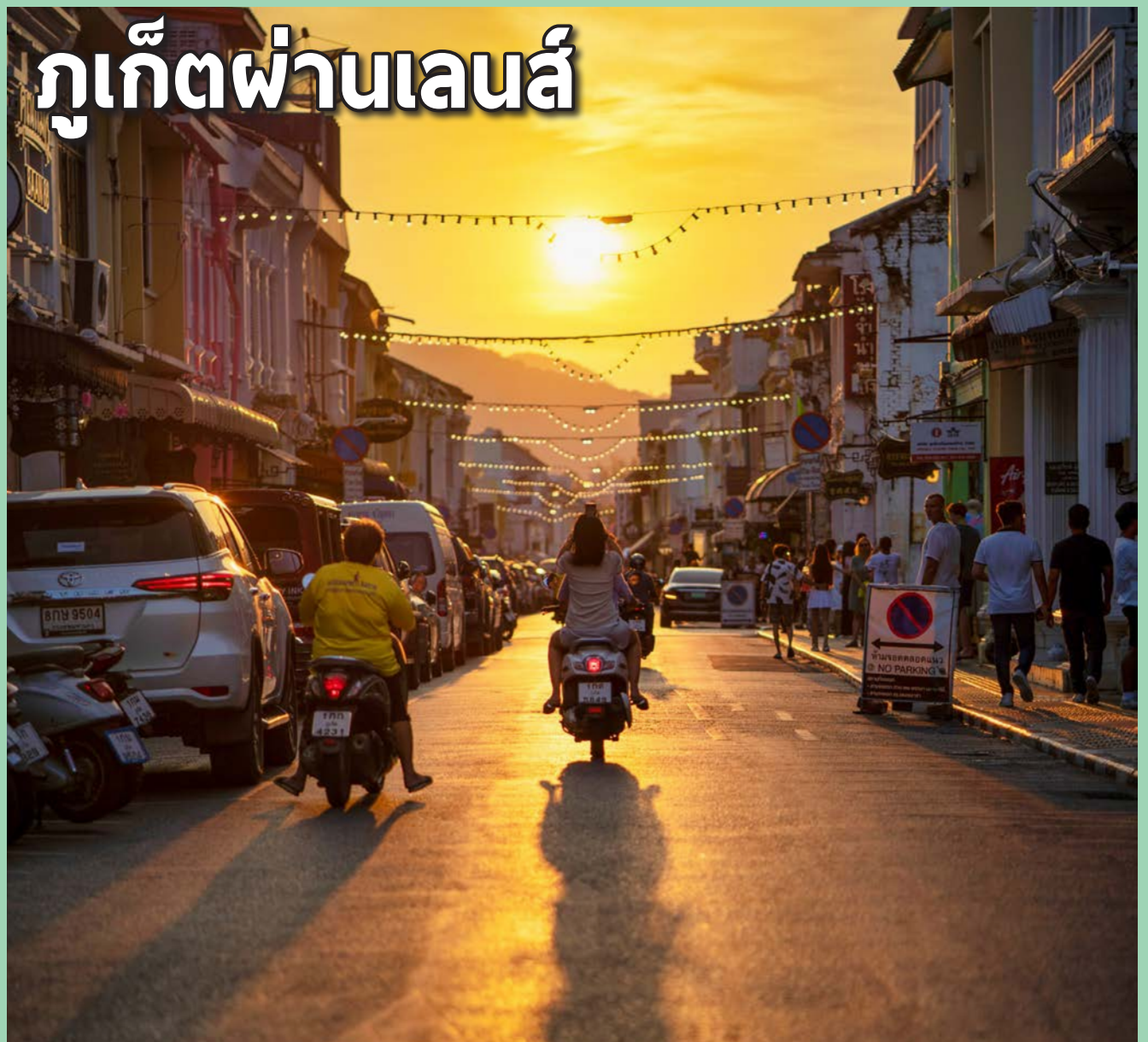
แสงอาทิตย์สีทอง ณ ย่านเมืองเก่าภูเก็ต

หากท่านมีภาพทิวทัศน์ที่สวยงามสะดุดตาสะกดใจหรือภาพแปลกของภูเก็ต (ความละเอียดภาพสูง) ส่งอีเมลมาได้ที่: thai@classactmedia.co.th