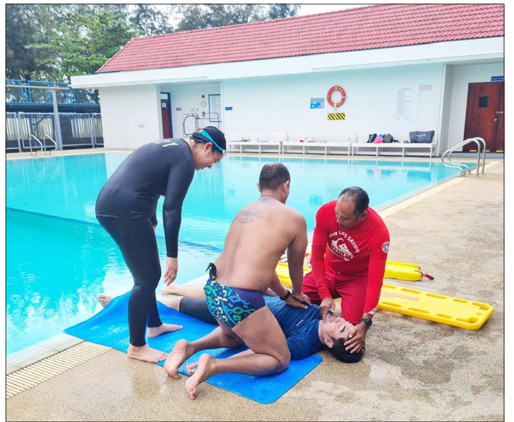
กิจกรรมฝึกการเรียนรู้ในการช่วยเหลือและปฐมพยาบาลฉุกเฉิน

ขั้นตอนแรกคือการดึงดูความสนใจโดยไม่ต้องกลัวที่จะส่งสัญญาณเตือนที่ผิดพลาด ทำผิดพลาดแล้วเสียใจภายหลัง จากนั้นสิ่งที่สำคัญที่สุดหรือคำว่า 'golden rule' ในภาษาอังกฤษ ซึ่งกฎทองสำหรับผู้ช่วยชีวิตคือต้องไม่เพิ่มจำนวนคนที่ต้องการความช่วยเหลือ