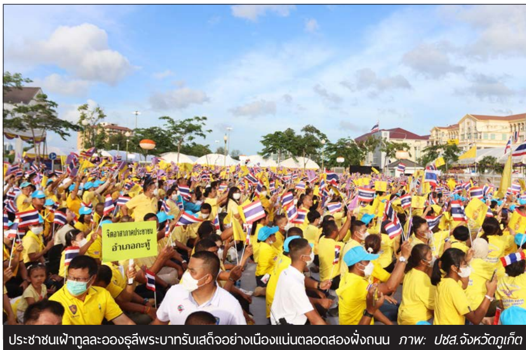
ประชาชนเฝ้าทูลละอองธุลีพระบาทรับเสด็จอย่างเนืองแน่นตลอดสองฟังถนน