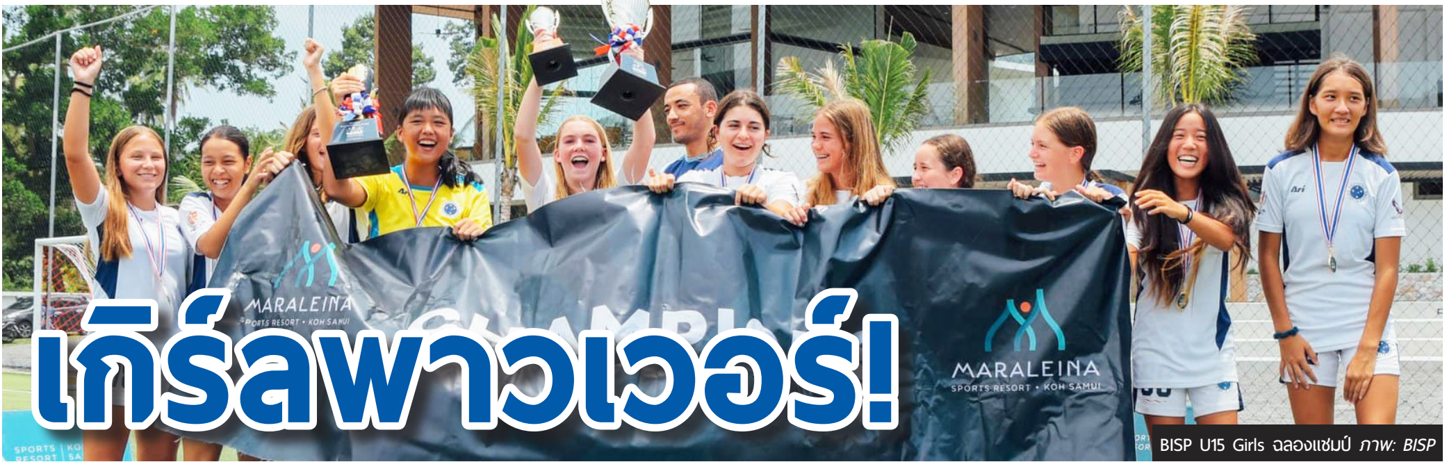
BISP U15 Girls จลองแชมป์