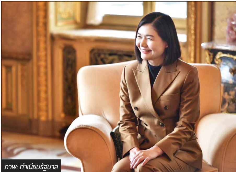
ภาพ: กำเนิดรัฐบาล

เมื่อวันที่ 31 ก.ค. ที่ผ่านมา งบประมาณ ดิจิทัลวอลเล็ต ในร่างพระราชบัญญัติ (พ.ร.บ.) งบประมาณรายจ่ายเพิ่มเติมประจำ