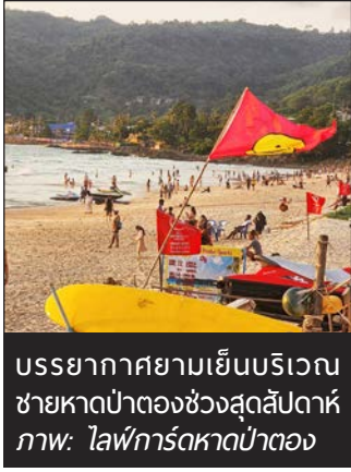
บรรยากาศยามเย็นบริเวณชายหาดป่าตองช่วงสุดสัปดาห์

■ เฟซบุ๊กเพจ Patong Surf Life Saving-ไลฟ์การ์ดหาดป่าตอง เปิดเผย รายงานสรุปผลการปฏิบัติการช่วยเหลือนักท่องเที่ยว ช่วงเดือนกรกฎาคม 2567 เมื่อวันศุกร์ (2 ส.ค.) ที่ผ่านมา ของทั้งชุดกลางคืนและชุดกลางวัน ตั้งต่อไปนี้