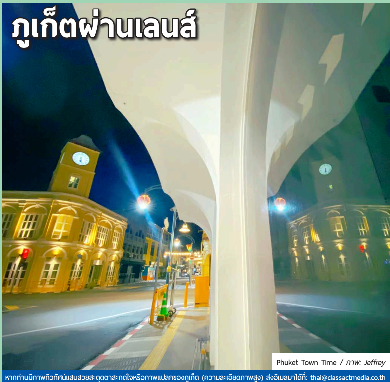
Phuket Town Time

หากท่านมีภาพทิวทัศน์ที่สวยงามสะดุดตาสะกดใจหรือภาพแปลกของภูเก็ต (ความละเอียดภาพสูง) ส่งอีเมลมาได้ที่: thai@classactmedia.co.th