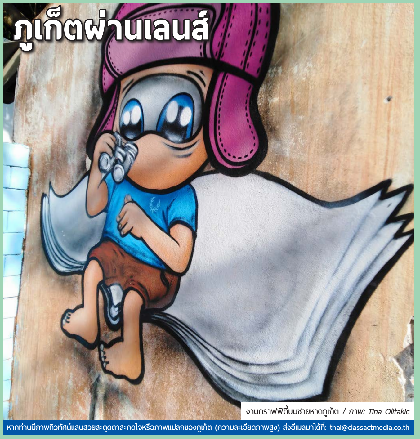
งานกราฟฟิพื้นชายหาดภูเก็ต

หากท่านมีภาพทิวทัศน์แสนสวยสะดุดตาสะกดใจหรือภาพแปลกของภูเก็ต (ความละเอียดภาพสูง) ส่งอีเมลมาได้ที่: thai@classactmedia.co.th