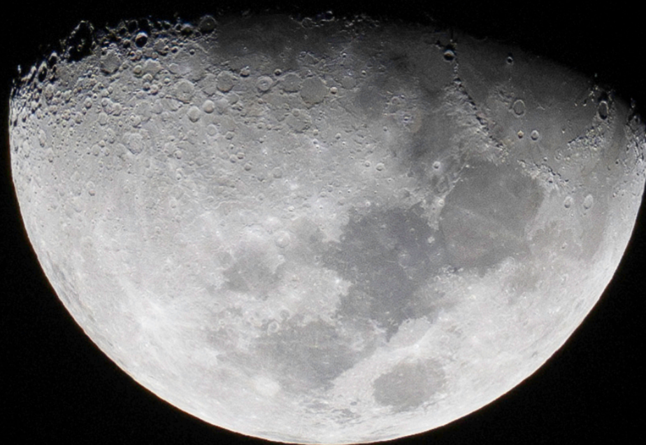
Moon with a view Apr 17 / ภาพ: Brian Stamm

หากท่านมีภาพทิวทัศน์แสนสวยสะดุดตาสะกดใจหรือภาพแปลกของภูเก็ต (ความละเอียดภาพสูง) ส่งอีเมลมาได้ที่: thai@classactmedia.co.th