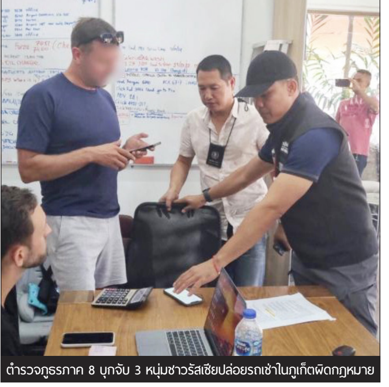
ตำรวจภูธรภาค 8 บุกจับ 3 หนุ่มชาวรัสเซียปล่อยรถเช่าในภูเก็ตผิดกฎหมาย

ตามคิวการรื้ออย่างเคร่งครัดเช่นเดียวกับคนไทยคนอื่น ๆ” เธอกล่าว พร้อมทั้งสัญญาว่าจะให้บริการ ให้ความช่วยเหลือ และให้คำแนะนำทุกครั้ง เพื่อให้ผู้เข้ารับบริการได้รับประโยชน์เพิ่มขึ้นในทางการแพทย์