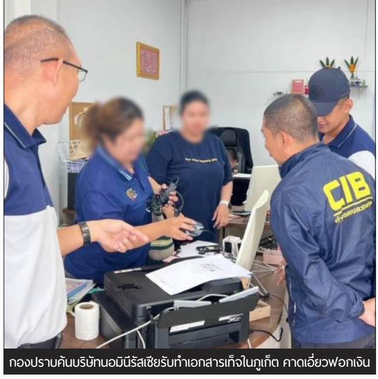
กองปราบค้นบริษัทนอมินีรัสเซียรับทำเอกสารเท็จในภูเก็ต คาดเอี่ยวพอกเงิน

“ค่ารักษาพยาบาลจะต้องได้รับการชำระก่อนที่ผู้เข้ารับบริการจะออกจากโรงพยาบาล ซึ่งหากผู้ใดไม่ได้ทำการชำระค่าบริการทางโรงพยาบาลจะมีทำการจดบันทึกและอาจส่งผลให้บุคคลนั้นอยู่ในรายชื่อแบล็คลิสต์ เนื่องจากบริการทางด้านสุขภาพไม่ได้ให้บริการฟรี ฉะนั้นจึงขอสนับสนุนให้ทุกคนมีประกันสุขภาพหรือประกันการทำงาน และปฏิบัติ